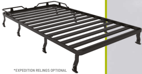
*EXPEDITION RELINGS OPTIONAL

DER AUSRÜSTER FÜR DAS ULTIMATIVE ABENTEUER